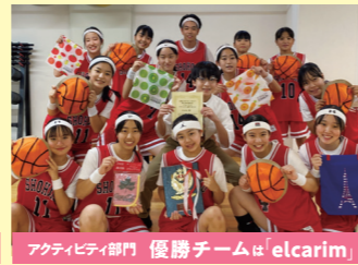
アクティビティ部門 優勝チームは「elcarim」