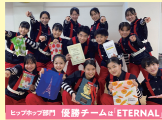
ヒップホップ部門 優勝チームは「ETERNAL」

優勝チームのメンバーは遅いお子さんから小学5年生からダンスを始めています。ダンスを習いたいと思っている皆さん、全国大会レベルの指導を受けてみませんか。